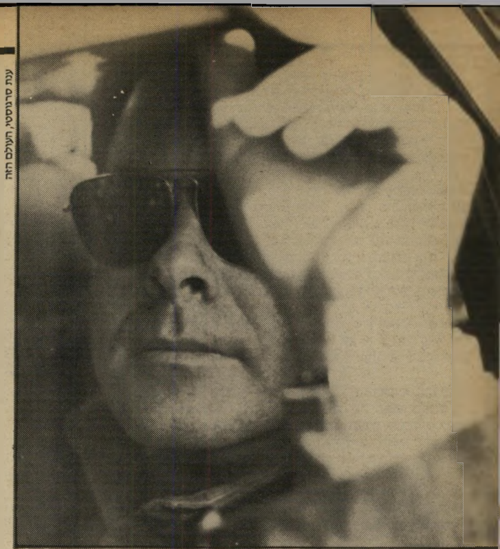
עיתון סריגוסטי, העולם הזה