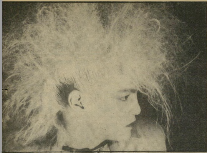
ניני בסרט "עורבים" התקבלתי מפני שאני יפה"

מאשר לשאר בני-גילי. עוד כשהייתי ילד קטן, הסתובבתי תמיד עם מבוגרים ממני. אבל בגיל 13 הגעתי למצב שהאנשים כבנימינה כבר לא עינינו