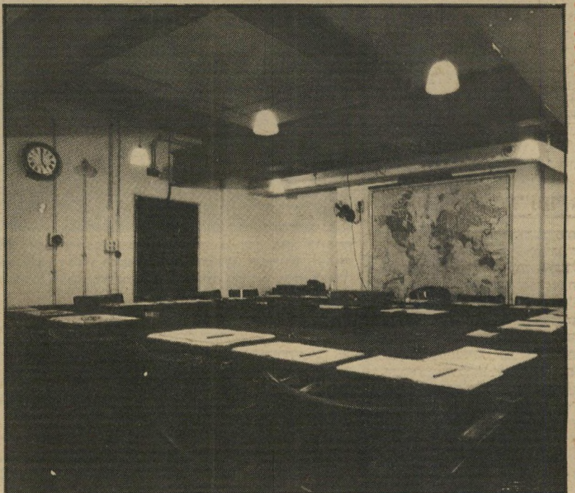
חדר המילחמה של וינסטון צ'רצ'יל כמה שמוציא אפטר לקנות בשעת-היום?

הוא יסתובב שם שעתיים, ישווה עם חרדיי המילחמה בישראל, יזכר בכל מה שהוא קרא על מילחמת-העולם השנייה ועל צ'רצ'יל ויהיה נורא מבוסס. ואת הרי יודעת כמה שמונסע את יכולה לקנות בשעתיים, כשהוא לא איתך.