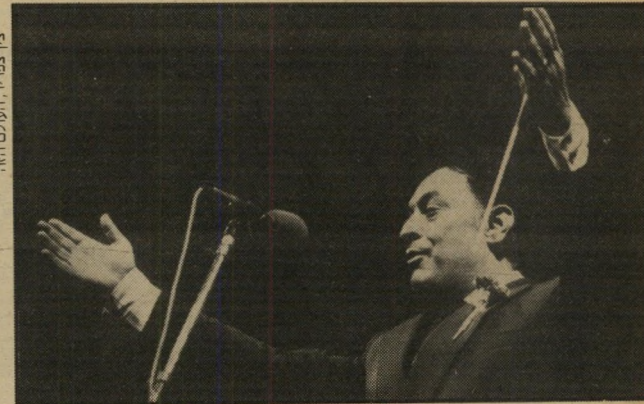
זבין מהטה, העומלם הזה

מנצח התיזמורת הפילהרמונית הישראלית, זבין מהטה , נתן באחרונה קונצרט עם התיזמורת של פירנצה בניסיון עומאן, והדבר התאפשר תודות לתרומת איש-עסקים ישראלי, הרוצה לפתח יחסים טובים עם עומאן. הדבר נודע לכתב ניו-יורק טיימס, שראיין את מהטה באחרונה. הראיון התפרסם