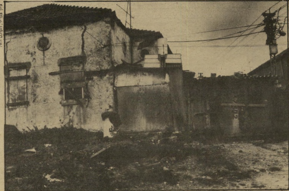
בית אופייני בגטו הערבי ביפו זה לא מענין את צ'יץ

חימל הוא תושב יפו. מישפחתו מתגוררת בעיר כבר 362 שנה. כי הפגנה ביפו הוא לא נטל חלק, אולם לדבריו "ציפיתי לדברים יותר חמורים. אין כאן מישפחה שאין לה קרובים בגדה המערבית או בעזה. אנחנו לא יכולים לעבור בשתיקה על מה ש' עושים להם!" אחרי 1967 חודשו הקשרים המיש' פחתיים, נוצרו קשרי מישפחה חרשים עליידי ג'סואין. כשפרצו המהומות כי שטחים הכבושים, לא יכלו תושביה הפלסטיניים של יפו להישאר אדישים. הם נענו לקריאת ועד ראשי המועצות המקומיות הערביות לקיים שביתה כללית, וזו התפתחה להפגנה אלימה.