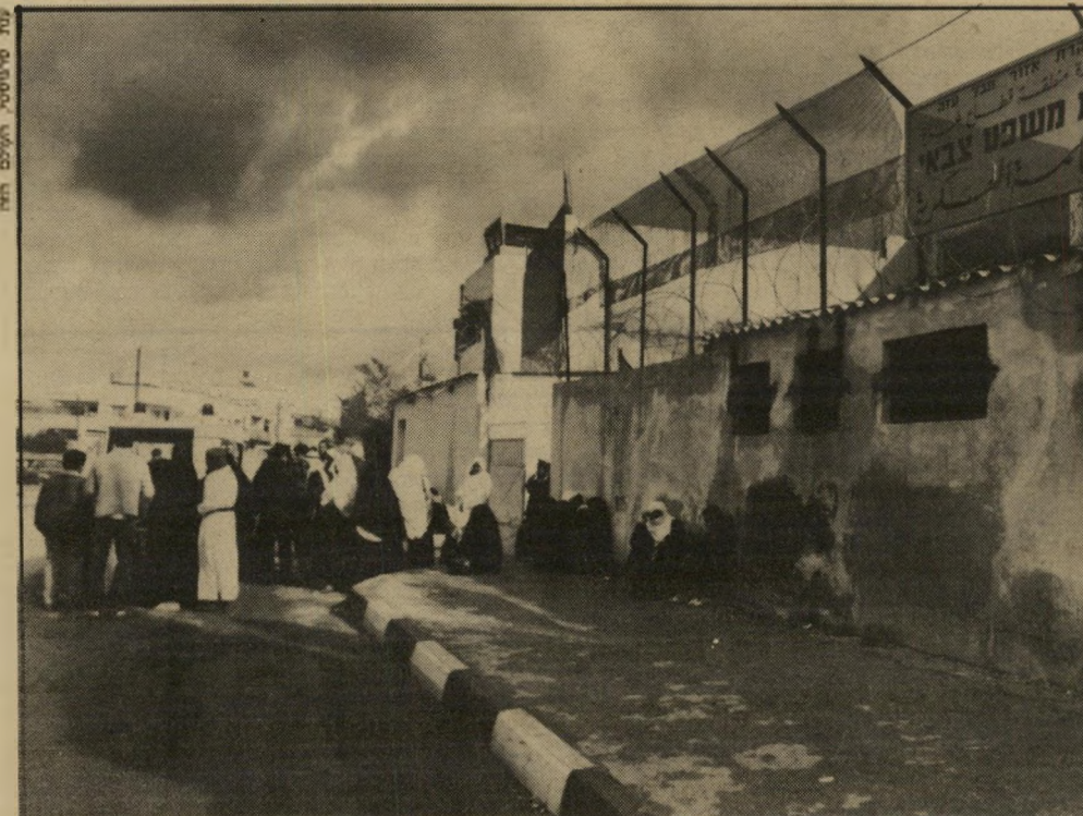
של הנאשמים. לקרובי-מישפחה אין מתירים, בדרך-כלל, להיכנס לאולם-המישפט. גם כשאורך המישפט עד השעות המאוחרות, ממתנות האמהות בסבלנות. ליד בניין בית-המישפט הצבאי בעזה ממתנות מדי יום מישפחותיהם

וכך הוריד אותנו עורך-הדין העותי כפתח בניין בית-המישפט, ולא נכנסו איתנו פנימה. כשישבנו באולם הוריד השופט את מישקפיו, הביט בנו, ובעיקר באורי אבנרי, ושאל: "לאיזה כבוד זכינו בנוכחותך?" הסברנו שרק באנו להתרשם ולראות, והמישפטים נמשכו. יתכן שנוכחותנו במקום שינתה מעט את האווירה. כתב-אישום ממוצע הוא דף-נייר המודפס בסטנסיל, שבו יש מקומות ריקים למילוי התאריך, שמות הנאשמים, פרטים ספציפיים של האירועים המיוחסים. יש בכתב-האישום הסטנדרטי הזה ארבע עבירות אפשריות, אפשר לבחור באחת מהן, בשתיים, בשלוש, או בכלן. העבירה הראשונה היא פעילות נגד הסדר הציבורי. השנייה היא השתתפות בתהלוכה או באסיפה. השלישית היא הפרעה והרביעות תקיפת חייל. למשל: "פעילות נגד הסדר הציבורי, עבירה לפי סעיף 68 לצו בדבר הוראות-ביטחון. פרטי העבירה: הנאשמים) הנ"ל, בתאריך..... או כסמוך לכך ב..... עשה/עשו מעשה הפוגע או עלול לפגוע בשלום הציבור או בסדר הציבורי בכך ש....." מאחורי דוכן השופט ישב גבר בשנות ה-40 לחייו, בעל תיפוף קצוזה. הוא הרכיב מישקפי-קריאה, והיה לבוש במדים מגוהצים, שדרגות סגן-אלוף עיטרו את כתפיהם. לצידו,