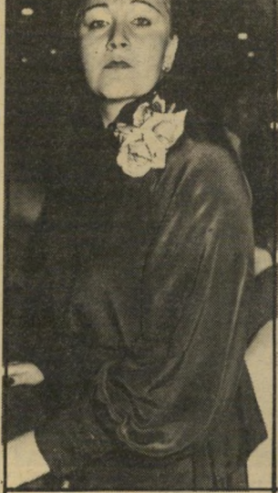
לורמילה תיכון החמיצה לה פנים

גיבורת הסיפור עצמה נתנה לי להביץ בשיחה טלפונית שהסיפור נכון. אלא מה, היא בכלל לא רוצה שהוא יודפס בעיתון, ולכן היא לא מוכנה