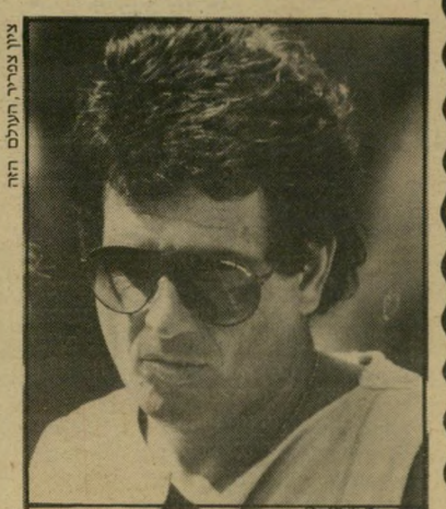
שלום פנסטר הציור נעלם

שמעתי שממש אתמול חזרה התמונה למקומה על אחד הקירות של המועדון, ובא לציין גואל.