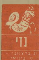
גדי 21 במרץ - 20 באפריל

נסיעה שתתקיים ב-30 או ב-31 בחודש חשובה לעתידכם. פגישה מיקרית יכולה לגרום לכם לשנות קור-חשבה ולחם לים על דרך חדשה ושונה מאוד מהקודמת. ידידים וותיקים יגרום לאכזבה ב-3 או ב-2 בחודש. המתיחות בבית תתנבר באותם ימים. הפטוב ביותר הוא להתר-חק. לצאת לנסיעה, לטיול או לשנות מעט מהרגליים הקבועים. בתחום הרומאנטי, מרצוי לעמוד על סודיות, ובכל זאת נראה שפרשה סודית עומדת להיחשף ולגרום לכם אי-נעימות ואולי אף מריבה קשה.