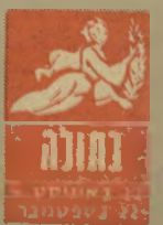
גדי 21 במרץ - 20 באפריל