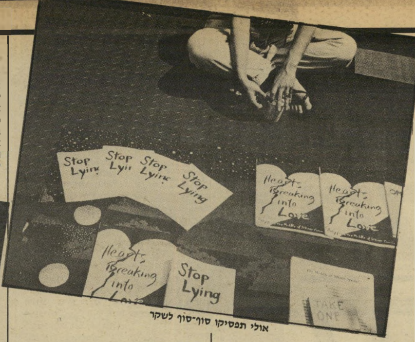
אולי תפסיקו סוף־סוף לשקר

לכל־יך הרבה אנשים יש כיום גופות נפלאים עד שהכרכובות הברשנית של "אשרי יושבי בני" שפעם, בעבר, נראתה נורמאלית נראית היום תגרע באמת. אין באמריקה מקום שאתה מסוגל ללכת אליו מבלי לפגוש בו נערים ונערות וגבי רים ונשים הנראים כאילו היו אתלטים מקצועיים כל ימי־חייהם. כל אחד רץ ורוכב על אופניים ועוסק בהתעמלות ושוחה או גולש במגלשיים וכולי וכולי. כך שאם אתה רק עובר במישרך שלך ואחרי־ך שותה כמה כוסיות והולך הביתה לראות