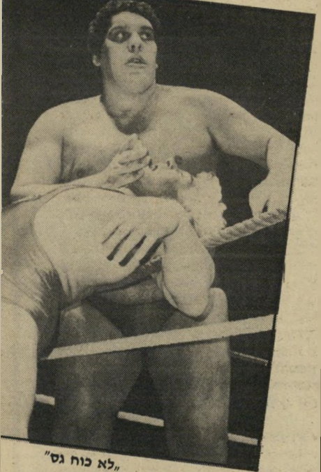
לא כוח גס

אני אוהב את האמנות שנוצרה בימי תוכנית האמנות הפרדאלית של הנשיא רוזבלט בשנות השלושים. האנשים הגדולים והחזקים עם שרירי העבודה שלהם הוועיה. ואז חשתי לעצמי, כיצד ייראו ציורי־הקיר של פועלים בני ימינו? אומרים שהפכנו כיום לכלכלה של שירותים — שיש הרבה יותר אנשים שמוכרים המבורגרים מאשר כאלה שמיצרים פלדה ודברים כאלה. אז האם יציגו ציורי־הקיר הענקיים של ימינו אנשים יושבים ליד מסופי־מחשבים ואנשים שמוכרים לך טוגנים? האם קיימת בכלל ררך להביא דברים כאלה לירי כך שיראו הרואיים?