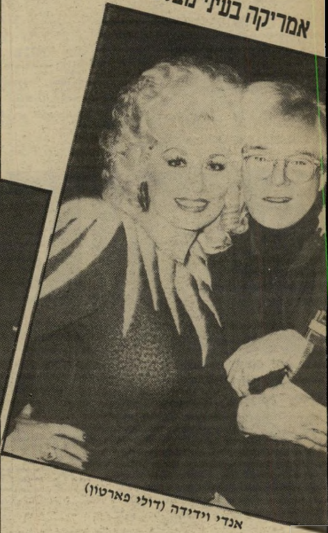
אנדי וידרה (דולי פארטון)

לא, אין זה ניקרה שאחד מספריו האחרונים של אנדי וורהול, מי שקנה את מקומו בתולדות האמנות כאחד מיוצריה של אמנות המופ האמריקנית, היה ספר-תצלומים דווקא. הדבר משקף את עליית קרנה של אמנות זו בתודעת הציבור - עלייה המשקפת יפה גם בריבוי התערוכות והאלבומים, בהתרחבות חוגי האספנים וב-מחירים המאמירים, המתחילים להתחרות באלה של ציורים. מאז הדיוקנאות הראשוניים של וורהול - דיוקנאותיהם של מרילין מונרו, ז'אקלין קנדי, אלביס פרסלי והדפס המרק של קמבל אשר הוציאו לו מוניטין מחוץ לתחומי ארצו - ועד להדפסים המאוחרים של לייזה מינקלי, דיאנה רוס, ארנולד שווארצנגר ו...דונאלד דאק (מק' דימן המצוייר של ה"חבובות", אף הוא סמל לעולם הספק-מבוגרים ספק-ילדים האמי ריקאי), ליוותה המצלמה את אנדי וורהול בכל אשר הלך. וכמו המיכחול והעט והחרט שלו, אף היא מתעדת עולם שכולו פופ, ברוחו אם לא בצורתו החיצונית; כולו שופע ושימת-חיים והנאת-חיים, ראשוניות וקסם-הנושא, קסם-מראית-העין.