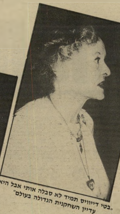
"בטי דייוויס תמיד לא סבלה אותי אבל היא עדיין השחקנית הגדולה בעולם"

אם תרצו - זו רק אגדה. כך גם הצילום שבו בחר לעטיפת סיפורו: אנדרטת החירות כשהיא מוקפת פיגומים - תמיד צריך לתקן ולשפץ משהו, במנוע המכונית, בחללית אבל גם באנדרטה. והנה, כבמטה-קסמים דונאלד דאק, הופכת האנדרטה הפאתטית, הדראמטית, לסמל מופי לשעה, מעין מוסיאון-פומיידו-של-החירות, על כל פיגומיו וצינורותיו.