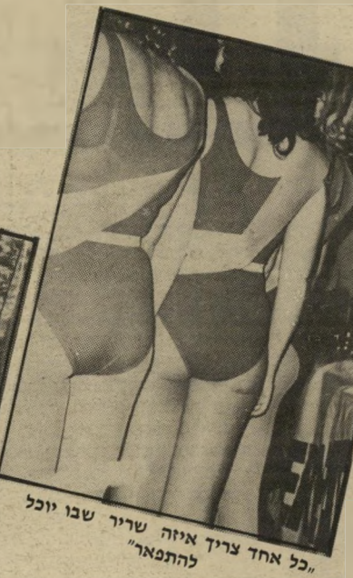
"כל אחד צריך איזה שריר שבו יוכל להתפאר"

המון רעיונות טובים פשוט נעלמים. כמו שבשנות ה-60 דיברו הכל על צורת-חיים חדשה, שבה כל כוח-העבודה יחולק לשלוש מישמרות נגות שמונה שעות כל אחת. כדי למנוע את הרחיסות ולהקל על התנועה. ואז אמריקה היתה עוברת 24 שעות ביממה ולא הולכת לישון לעולם. וכל אחד היה יכול לבחור לעצמו את שעות העבודה הנחות לו. עכשיו איש כבר אינו מדבר על כך.