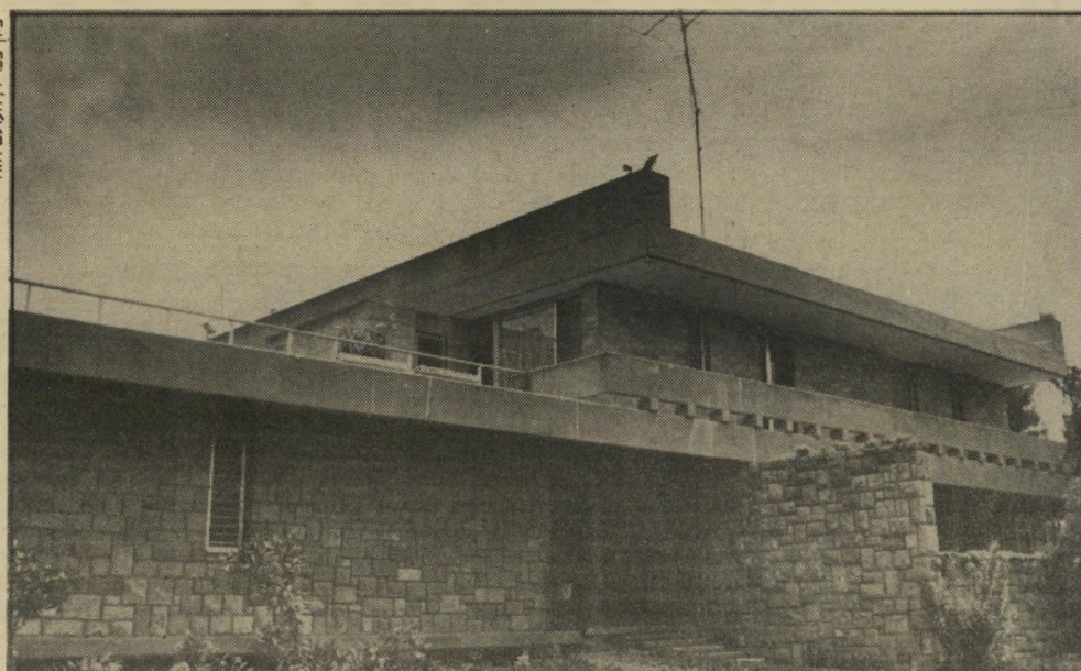
בית איזנברג בסביון