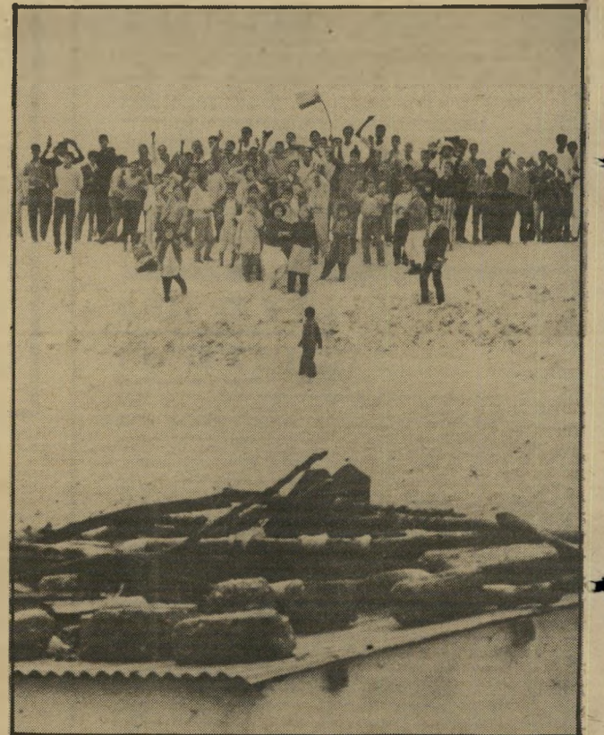
הפגנה עם דגל פלסטיני (עזה, 1969)

היה עלי למצוא תירוצים שונים, כדי לצאת מן הבית. היה זה קשה במיוחד, מאחר שהייתי הבת היחידה ומישפחתי הגנה עלי במיוחד, בייחוד אחרי נפילת אחי. אבל היה זה מצב זמני, שנמשך כמה חודשים בלבד. בינתיים הספקתי לסיים את בית־הספר התיכון, והתחלתי ללמוד במיכללה. המורה שלי היה בעבר חבר בחזית העממית, והיה ער לעובדת היותי פעילה באירגון. כאשר היה צורך בכך,