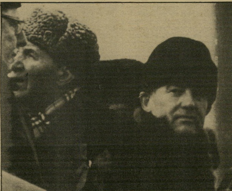
יורד מן המטוס: גורבצ'וב, בפאמחה (כובע פרווה רוסי)

אלכסנדר פלמינג, ממציא הפניצילין. האנושות נאלצה להמתין מאות שנים עד שמצאה משהו טוב יותר" ממרק העוף, גור השופט.