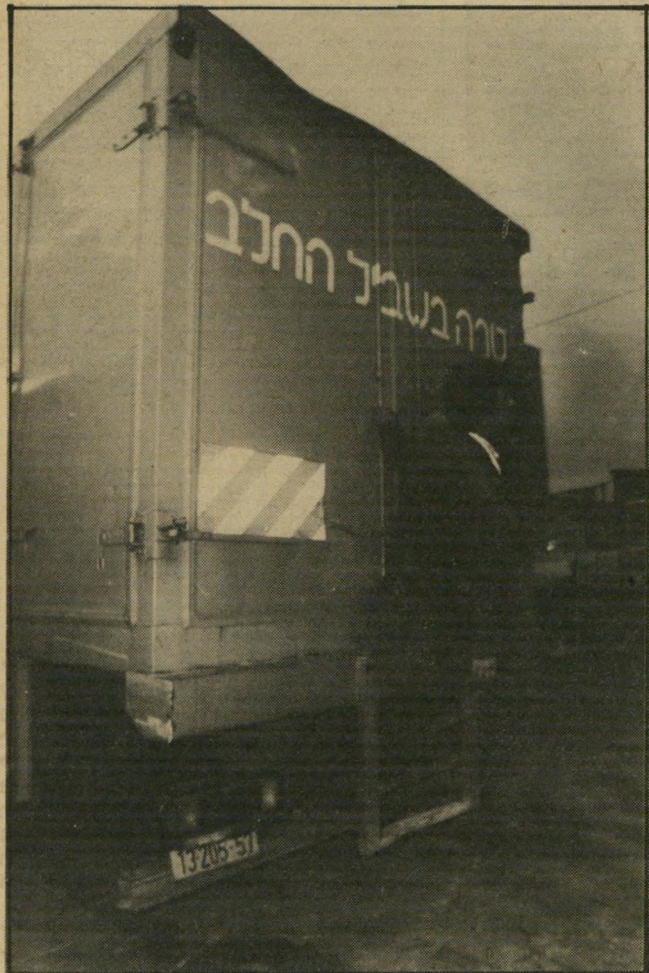
מישרד כוחהארם ב"טרה" אוי מקבל אותך כפי שאחיהו