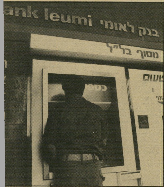
"בנק לאומי" זו תהיה בעיה, בנל העבר שלך...

העניין. קשה לי להאמין שהם יסכימו שתפתח חשבון. אתה יודע! מי שעשה פעם אחת שגיאה, יכול לחזור עליה שוב". נכנסתי לדבריו: "תהיה גלוי איתי. אני מעדיף את זה, ושלא ידברו מאחורי גבי. חוץ מזה, אני מבין אותך, כי זה לא העסק הפרטי שלך. תהיה חופשי איתי. זה בסדר". או הכחנתי שהוא מדבר בחופשיות רבה יותר, והוא אמר: "זו תהיה בעיה, בגלל העבר שלך. יש לי ביטחון שהמנהל לא יסכים לפתוח לך חשבון".