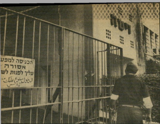
מיפעל "ריגה" בוצעו כאן ניבוחים...