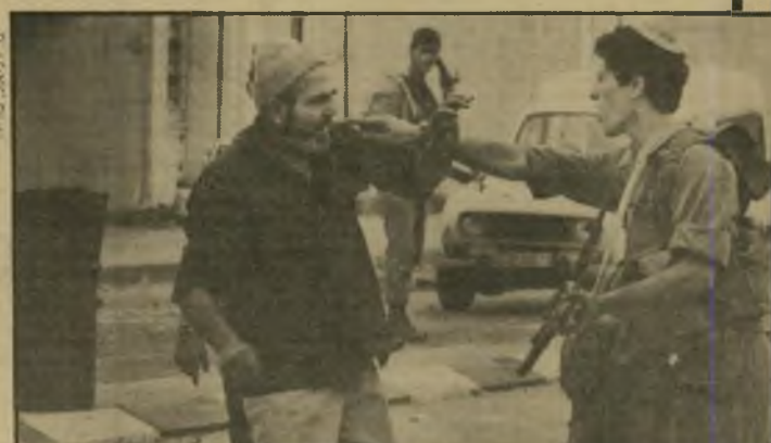
עימות יומיומי: חייל צה"ל ו„מקומי“ ההשפלות כאבות יותר מאשר ההרג