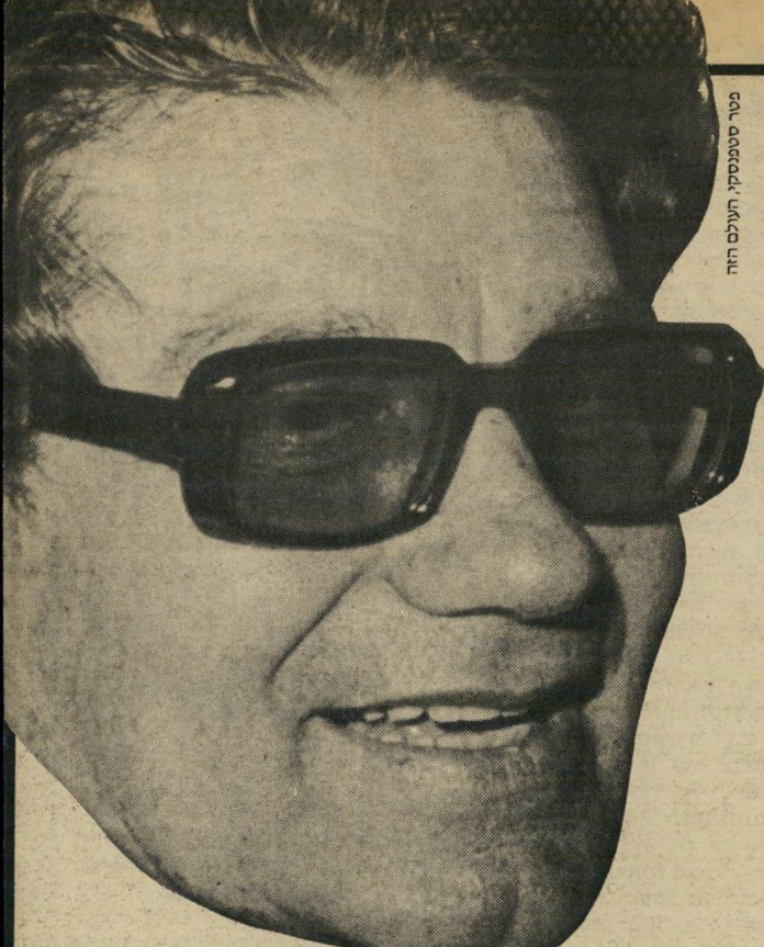
ספר סטנפורד, תולעים הזה

אשר ידליו (משמאל) נקרא לעזרה: שני ה' ישראלים החקוטו באמריקה והתחריטים היקרים נעלמו