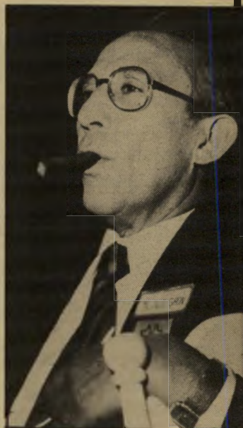
מיליונר גאון רכישה ברכיבים לא כשרות

חבר-מושבעים גדול במנהטן הודיע לנשיאה כעבר של הפיליפינים, פרי דיננד מרקוס, לרעייתו אילמדה ולאחים יוסף ורלף ברנשטיין כי נפתחה נגדם חקירה פלילית בקשר