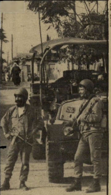
חיילים בעזה, מחזירים להם לירות

יתכן שגלי-ההפגנות הסוערות יירגעו בימים הקרובים, אך הוא ייתר אחריו דם שפוך, פצועים, מישפחות שכולות, והרבה צעירים וזקנים, שיתחילו להא-