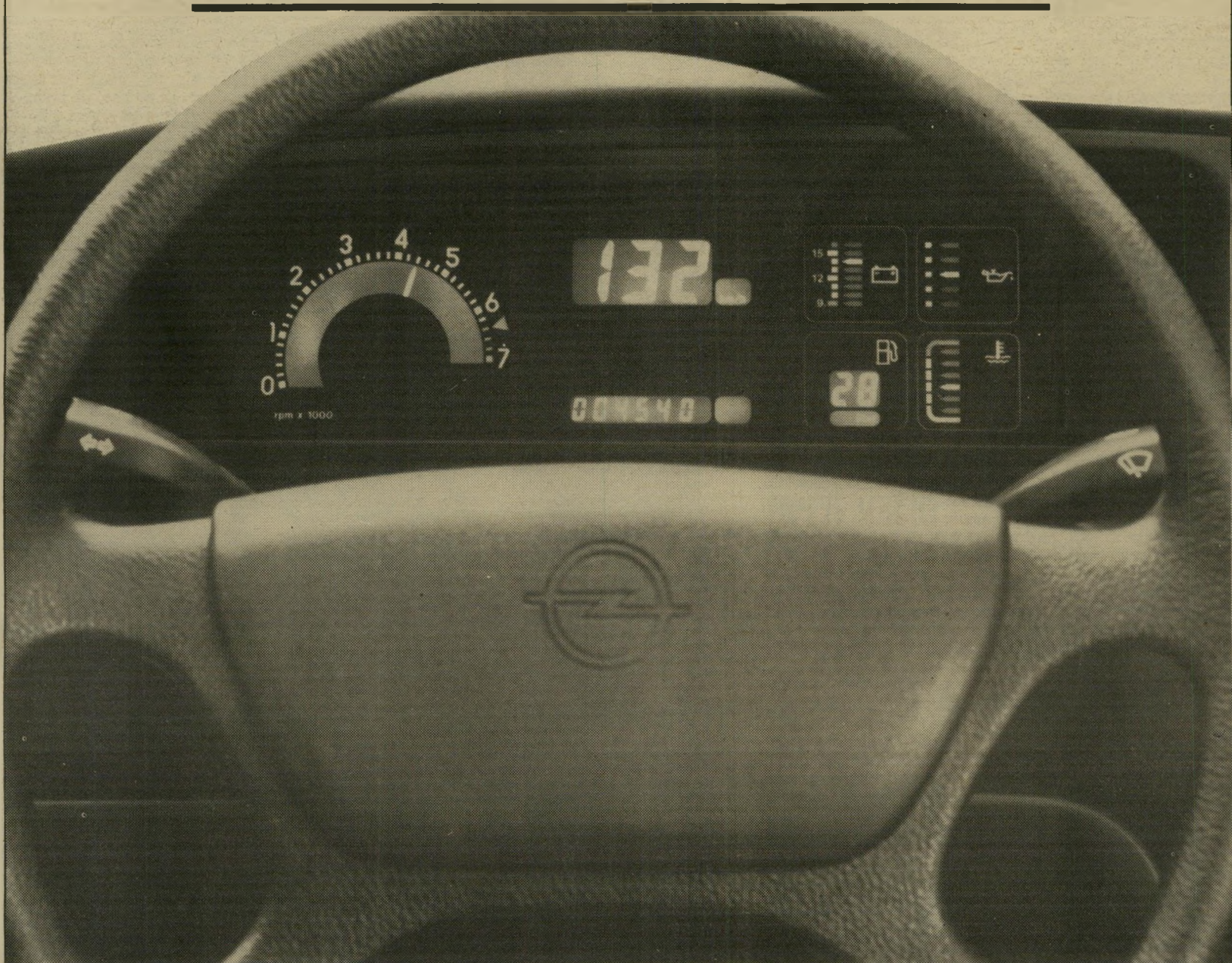
לוח מחוונים דיגיטלי (LCD) לפי הזמנה מיוחדת.