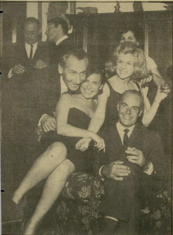
פרדריקה בפעולה* כוס-משקה ופלירטוט קל

פ ה ישרם היו מסיבות פרטיות. מי שחזר מחוץ לארץ — ואז לא רבים נסעו ולא רבים חזרו — הביא בקבוקי-ויסקי ואסף את כל החברה. על הרולצ'ה ויטה הם שמעו מהסרטים האיטלקיים. בתחילת שנות ה-60 אפשר היה עוד להרגיש את שאריות הקוקואים והסראפנים, הלכניה פינתה