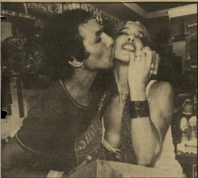
מעריץ בחנות הגבר האלמוני ביקש מאניטה לנהוג כמיני-הג צ'יצ'ולינה, ולהתפשט כליל, אניטה סירי-בה לזאת, אך נתנה לו פיצוי, נשיקה מצלצלת. הגבר לא הירפה והמשיך לבקש. סבלנותה לא פקעה. כפוליטיקאית מנוסה היא התחמקה מזה.

גם מן הגברת האיטלקיה צחקו, כיום היא הצוחקת במסעותיה ברחבי-העולם, וגם בישראל, כשמוסיפים לשמה את התואר: "חברת בית-הנכחרים".