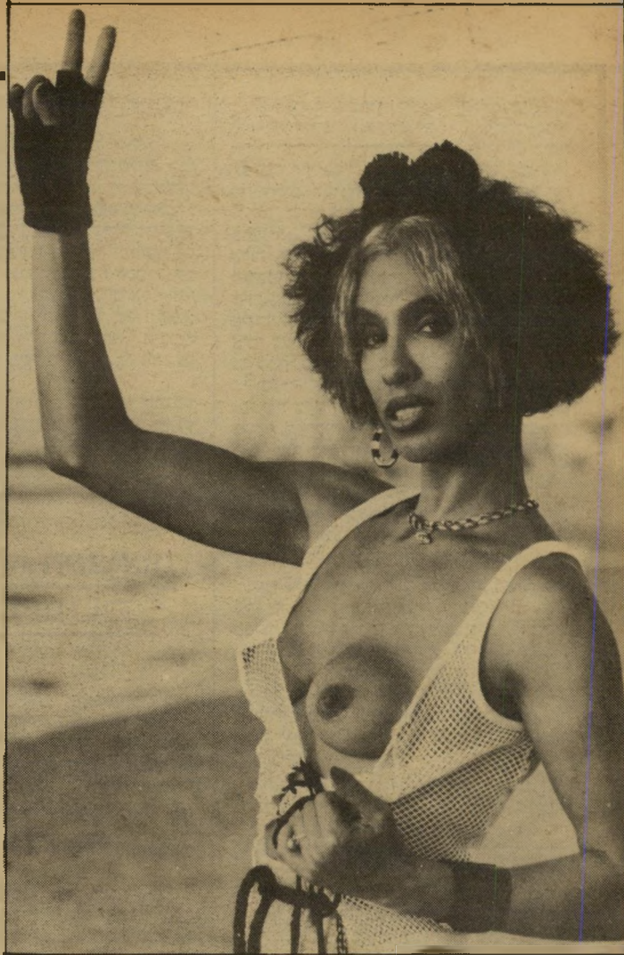
לא טעית, זו אניטה אניטה במוזה צ'יצ'ולינית טי-פוסית. גם היא כמו האיטלי-קיה רוצה להיות חברת-כנסת. הסיסמה שלה: "יחי החופש המיני".

וכך, נאמנה לאיריאולוגיה — מין לחוד וכסף לחוד — היא חיה במצב כלכלי קשה, שקועה בחובות בגלל דירה ששכרה ברמי-מפתח, ומקור-