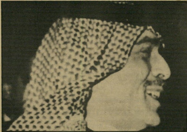
חוכיין — מאחורי ההסכם המדיני

Israel as a Crucial Factor The prospect of possible Israeli action against the pipeline became crucial to its fate. Several former Government officials involved in the project said Mr. Wallach had told he had had discussions with top Israeli officials to try to eliminate the possibility of an Israeli attack by obtaining some form of Israeli guarantee. Mr. Wallach, the former official said, described these discussions as having been sanctioned by the United States Government. Mr. Wallach also said that the project was crucial to advancing the peace process in the Middle East, the former officials said.