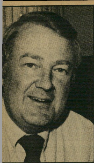
שר-מישפטים מיז עוד הסתככות בשעוריה

הגדולות בעולם, והיא פעילה ביותר בארצות-ערב, בעיקר בסעודיה. שר-הביטחון האמריקאי שפרש, קספר וייני-ברגר, ושר-החוץ הנוכחי ג'ורג' שולץ, כיהנו שניהם בעבר בהנהלתה. רפפורט ובכטאל היו מוכנים לממן את הפרוייקט, בתנאי שתובטח אי-פגיעה בו במקרה של מילחמה בין ישראל לשכנותיה.