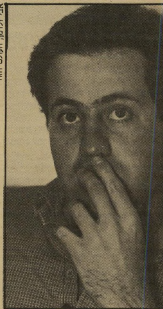
קצין הביטחון מורד המחזה היה מזועזע