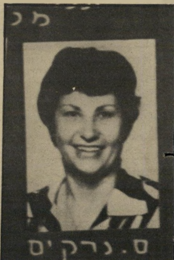
סגנית-מנהלת נרקיס היא אמרה לנו לא לדבר".

פיתרון ענייני, אף שניתנה "הסכמה" עקרונית.