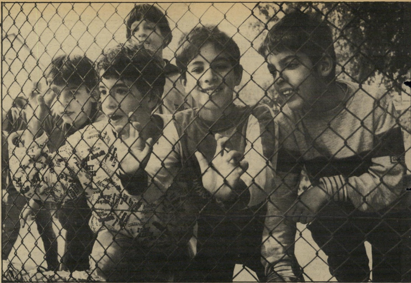
תלמיד שרון (שני מימין) וחבריו ליד גדר בית-הספר "לסלק אח הערבים".

המילה "ערבי" מסמלת לגביהם את כל הרוע שבעולם.