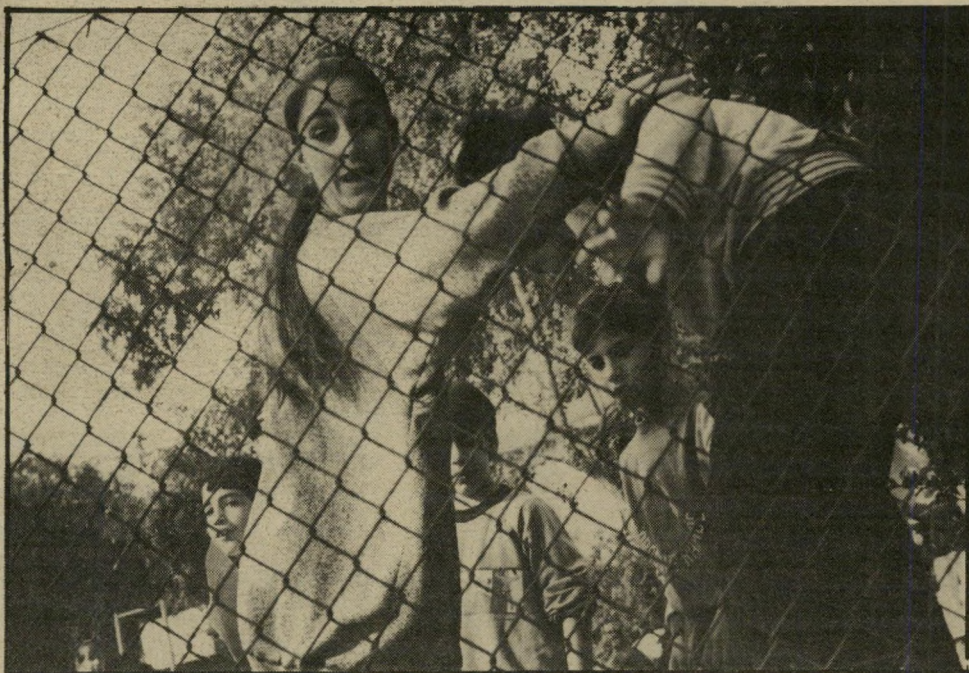
המורה התורנית מסלקת את התלמידים הסתלקו משטח בית-הספר

גם שורקים אם מוזעזעת נוספת, שחתמה על העצומה, היא אילנה לוי. לוי,