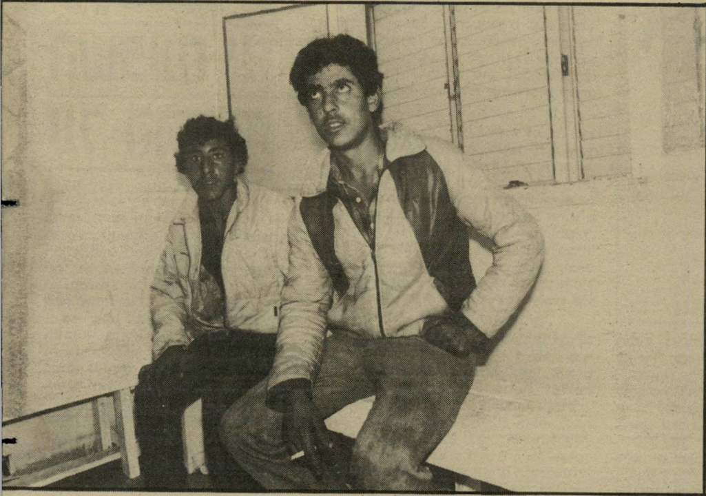
עובדים חרד ועיידה בחדריהמריבה אנחנו מפנים את האשפה מבית-הספר

מחויקה ביריה סלים מלאים במיצרכים לשבת, ממהרת לביתה, אבל לשם עניין חשוב כמו מיגור הפועלים מאיזור בית-הספר היא מוכנה להתעכב. הם ממש מסוכנים, כל הערבושים האלה, היא מנסה לפקוח את עיני השאננים שלא רואים את גודל הסכנה: כל האיזור הזה מלא בהם, כשהילדים יוצאים מבית-הספר הם מגיעים הנה, וזה ממש לא נעים. צריך שיתאספו רחוק מכאן. אנחנו מפחידים את הילדים לא. הפחד לא בא מהבית. הוא בא מהרדיו והעיתונים. הילדים שומעים על כל מיני מיקרים שקורים, והם פוחדים מערכים. כמו לאחרים, גם לה יש סיפור אישי. לפני כמה ימים חזרה הילדה שלי מבית-הספר ושני ערכים שרקו לה. ילדתה מהנהנת בראשה לאישור הסיפור.