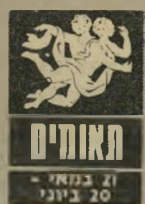
תאומים 21 במאי - 20 ביוני

עייפות גדולה וחולשה פיזית בין ה-2 ל-4 בחודש. אתם זקוקים למנוחה ולמקום להפיג בו את המתח. העינים רגישות מאוד ובעלי מישקפיים ש" בינכם כדאי שיגשו לבדיקה. יחסים מתי" חים עם בן-הזוג בין ה-5 ל-7 בחודש, אולם גם אם אינכם צודקים, נראה שהפעם באים לקראתכם וסולחים לכם. בתחום הרומאנטי אתם מרשים להעצמכם התנהגות חופשית ומתירנית מהרגיל ועלולים לסבול מכך.