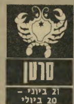
סרטן 21 ביוני - 20 ביולי