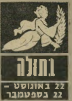
בתולה 22 באוגוסט - 22 בספטמבר