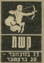
קשת 23 בנובמבר - 20 בדצמבר