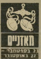
מאזניים 23 בספטמבר - 22 באוקטובר