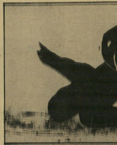
מנשה קדישמו: פרוטמיוס

עוצמת ארזים והיא כמו מרחפת ביו שמיים וארץ. כן, ב-עקרונות' של מנשה קרישמו מצאנו את היתו העז ביותר, ואם תרצו = הממאה הנוטה ביותר כנגד טבח החפים מפשע, עד שכל מה שנוצר עד כה בנושא זה בתחום הפיסול כמו נתגמד כעיני.