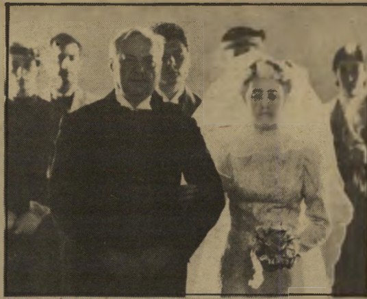
תרזה הקדושה - מתה משחפת בגיל 25

אילו הייתי צעיר יותר, הייתי מפרק לו את כל העצמות, הצהיר הבימאי הפולני, שהיה פעם מתאגרף, כשנשאל על יחסיו עם הכוכב האוסר טרי. זה היה מנומס יותר ושיחק את המסתאה הנצחית.