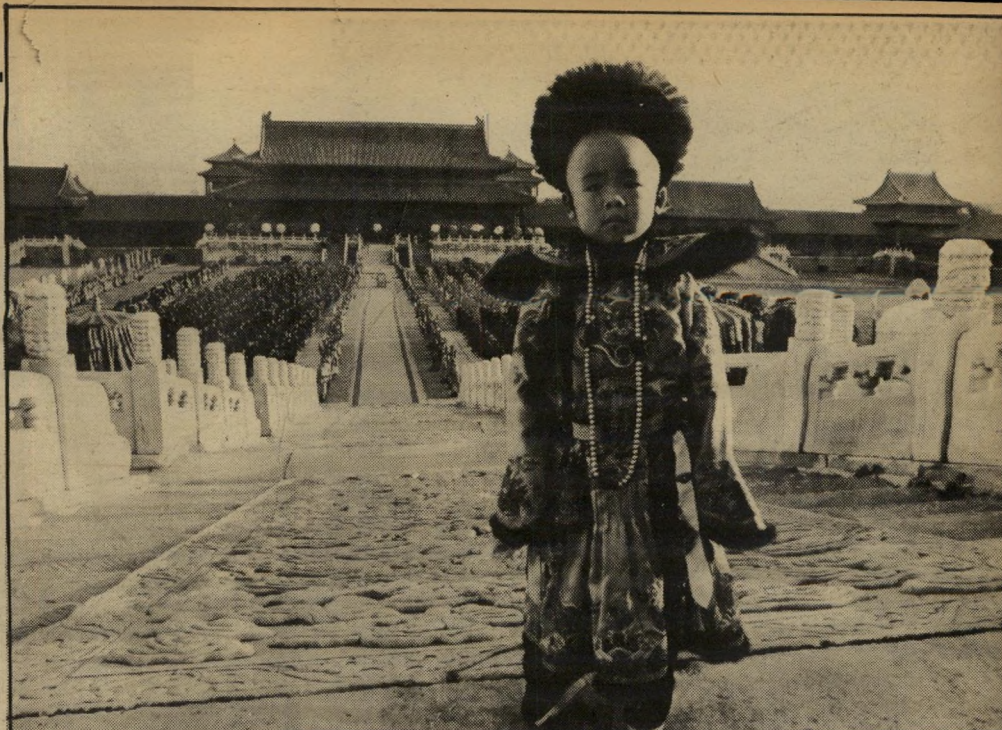
קיסר בן 3 פו אי (Pu Yi) בגיל 3. הוא בן למשפחה ויאטנמית המתגוררת בניו-יורק ונבחר כאשר התלווה לאחיו, שנבחר לתפקיד ולא הצליח. בהסרטה היה ריצ'ארד כבר בן 5. השעות הרבות תחת אבר וזרקורים, גרמו לילד הקטן עייפות רבה.

למין הרגע הראשון גילו הסינים נכונות להרשות לבני המערב לצלם את הסיפור בסין, אולי משום שהם מר-צנים בו באור אוהר ונאור, ללא תר-גיליהסחה דמגוגיים, שסרט הוליוודי היה נוקט בהם. ברטולוצ'י אכן לקח את המשימה ברצינות. הוא ערך תחקיר מפורט, נפגש, בין היתר, עם אחיו של הקיסר שחי עדיין, ונעזר בספרו של רג'ינלד ג'ונסטון, השקיעה. ג'ונסטון ששימש גם כמחנכו האישי של פו אי גולל בספרו זה את חייו של מי שהוא כינה הילד הבורד ביותר בעולם. אבל לרברי חוקרים גם קישט פה ושם את המציאות כדי לשלב את עצמו במעמדים היסטוריים חשובים. לגבי ברטולוצ'י, הסיפור כולו הוא מעין "אי.טי. תוצרת סין". פו אי היה כמו יצור מכוכב אחר שנחת כיום בהיר