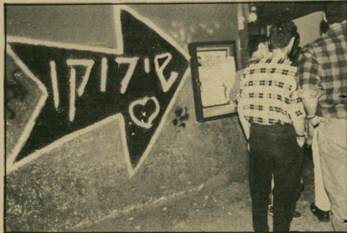
הכניסה ל"שירוקו" יש לנו טביעת עין'.

הנערים הרבים שעמדו בכניסה למור' ערוץ לא התרגשו מהתופעה. חלקם טר'