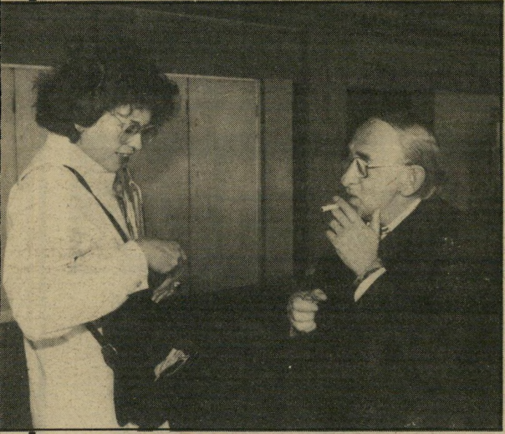
שותף טיבור האג'רו ואשתו איש שידע יותר מדי

אסולין נשאל אם אינו חושש שבי עיקבות עדותו זו יפטר אותו מעבר יתנו, והוא השיב: „לפחד אני תמיד יכול, אבל אני מקווה שיש עוד אנשים הגונים, ושאיני אמשיך לעבוד בדיונוף טונטר. ואני רוצה להוסיף בעניין זה: לא שאני פוחד מבעיות בעבודה, אלא אני חושש מפעולה שתיונק נגדי או נגר בךמישפחה שלי באופן פיסיו.“