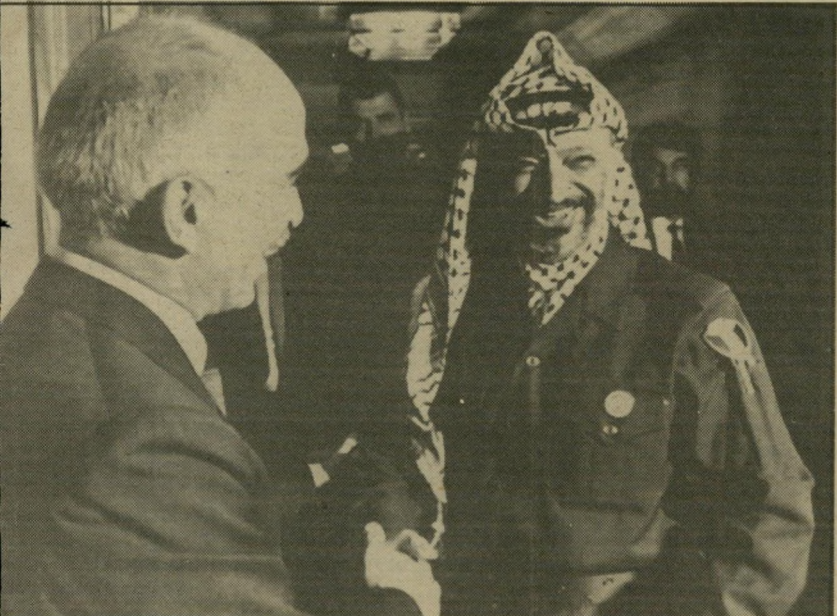
חוסיין עם ערפאת בפתח הוועידה. כמה פעמים צריכים לחזור על זה?

לפני פחות מ-30 שנה היה חוסיין הצעיר אדם בודד ונרדף. תחנות-השידור רבות-העוצמה של גמאל עבד-אל-נאצר השמיצו אותו מדי יום כבוגר, כסוכן ציוני וכמשרתם של האימפריי