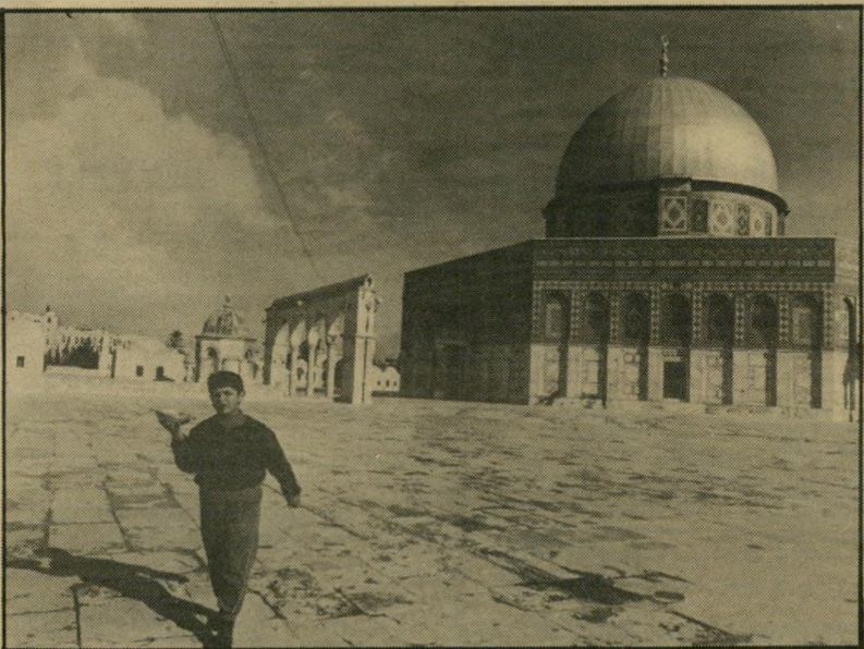
כיפת-הסלע בירושלים — בניינים נהדרים

מיטב יריעתי, לא היה, עובר בשם רוב גביש. משה גביש , סגן נציב מסי'הכנסה, ירושלים