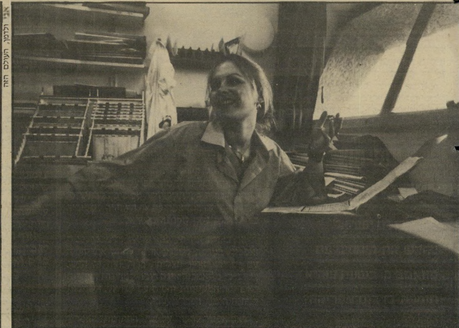
רופא רימון יש לדון על פי ההלכה