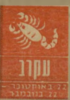
22 באוקטובר - 21 בנובמבר