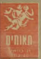
19 באפריל - 18 במאי