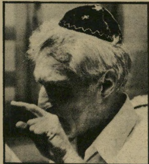
ראש-עירייה להט, מ"פ במלחמה

נחוג ♦ יום הולדתו ה-60 של שלמה להט, ראש עיריית תל-אביב זה 13 שנה. להט, יליד ברלין שגרל ברחובות, הוא אב לשני בנים, ועוד הספיק להיות מפקד-פלוגה בחטיבת ניבתי במלחמת העצמאות. בהמשך