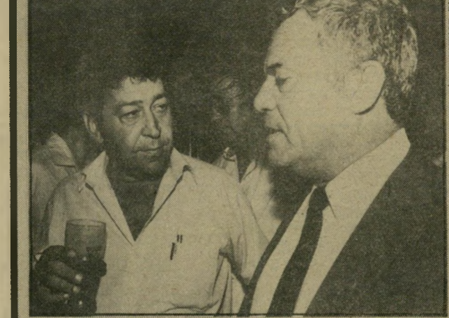
עם אברשה טמיר מי היה סגן-שרך

החוף. ברצונו להשתמש בהם — כדי לקדם את תהליך-השלום. מישרת סגן-שר, למשל, נחשבת כעמדה די סבירה להשיג כל זאת. סגן-שר חייב להיות חבר-כנסת, והלשונות הרעות ייחסו את "הפנצה" של טמיר לתיכנון מפורט של צעדיו הבאים. אין זה סוד, פואד נרעש מהכרזתו של טמיר. את הבחי"שות והבישולים בתוך המיפגות החלטתי להשאיר לאחרים ובי"קשתי לברר עימו כיצד הוא רואה עצמו בקדנציה הבאה. "שר או סגן-שר! הגיעה ה"תשובה הכנה, אחרי ערב ארוך. גם פואד מעוניין להגיע לעמ"דת-השפעה כדי לקדם את תה"ליך-השלום. הוא נשמע לי כן, רודף-שלום כחייל-לשעבר ומת-לבט. זה נשמע לי משכנע. גם קצת מוכר מהשבוע שעבר.