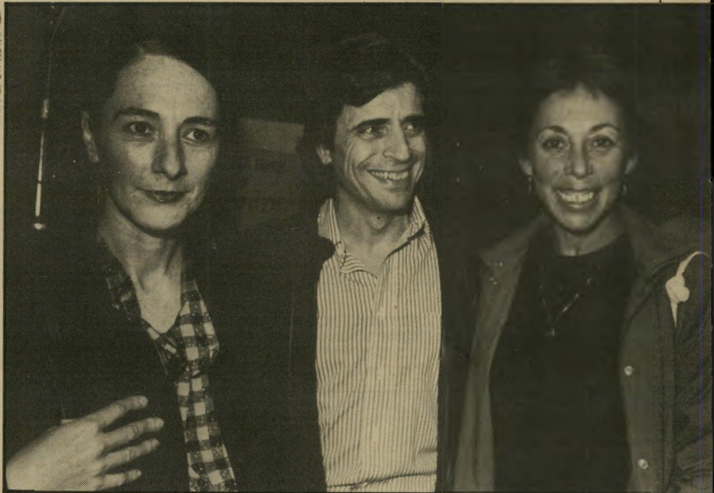
אבי ודסה העולם הזה

■ גם חברי הכנסת חיים קרי פמון רזה והתחנך, וגם הוא מתהדר, בימים אלה, במלתחה חדשה. קופמן איזור את בגדיו מלפני כמה שנים ונראה מתגנדר