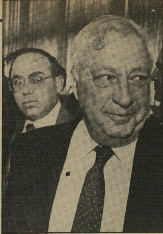
איש־שב"כ גינוסר (ליד אריאל שרון)