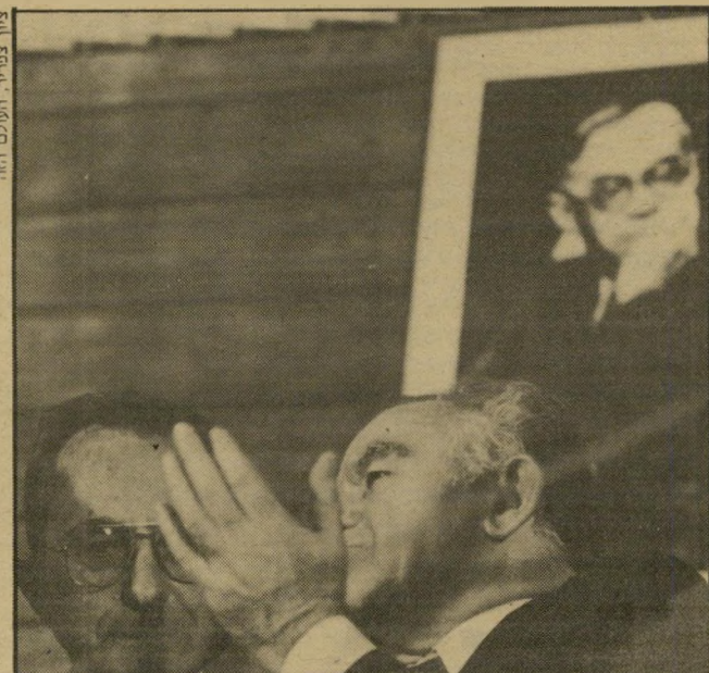
ארנס עם ז'בוטינסקי ושמיר האם בן-גוריון עדיף?

מצע למנוע התארגנות ארצית של האורחים הערביים, לפעול לחיסול הגופים הארציים הקיימים (ועד הסטודנטים הערביים, ועד הרשויות המקומיות הערביות, ועד תלמידי בתי הספר התכוניים, הוועד לשמירה על הארמות, וכו').