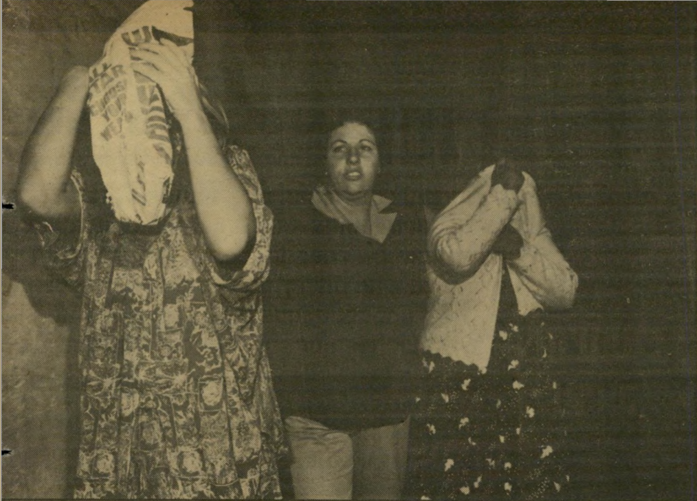
רוקחות-חשודות שמאי ובן-חן מובלות לבית-המשפט (באמצע: שוטרת) קל להוציא כסף —