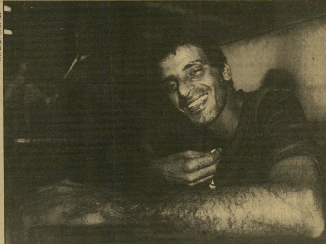
נאשם-בפיצוץ רדעי על ססל-הנאשמים אחרי 12 שנות-מאסר. חייך אושר