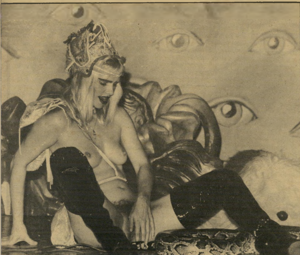
ולא הותירו מקום לדימיון. עיניים רואות ולא יראו. הקהל קרב, רוצה למשש, לגעת, אולי אף לטעום. לנחש זה כבר הספיק, לצ'צ'ולינה זו רק ההתחלה.