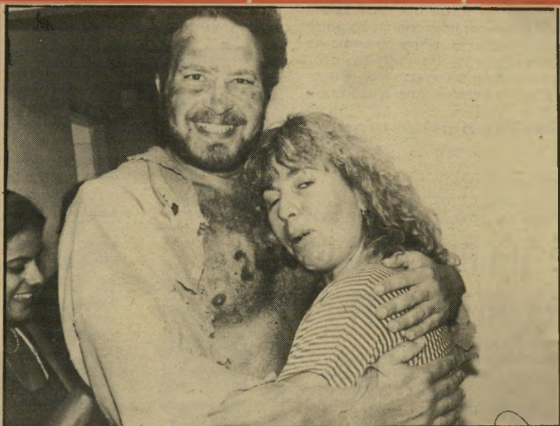
ציון טל