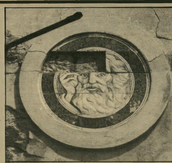
מיכלאנג'לו ברחוב אחד-העם

במשך השנים נהרסו הבתים והלכו. אנשים רבים דיברו הרבה על כך שיש לשמרם, אבל איש לא עשה מאומה, וכך מסוגל היום צביקה זליקוביץ לצלם הרס בתים: עמוד סדוק, קלאסי כביכול, עומד על כרע מוטברזל; בד מזוהי מתקלף על בליטת בית; קראמיקה של בצנאל המבקשת להעתיק את