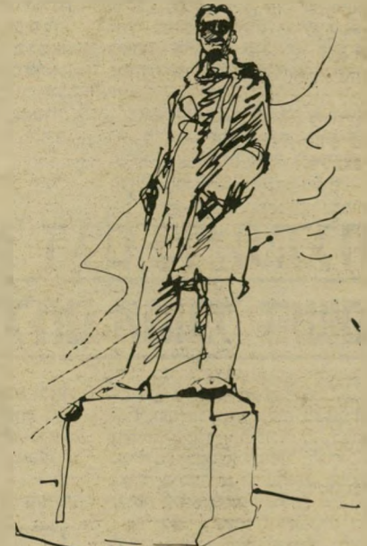
האנדרטה בכניסה לעיירה מאיאקובסקי

אתה פותח רלת צורה, אפיינית כל כך בחלקה העליון המקומר, כבחלונות המקומרים אף הם. כל המשקופים צבועים לבן, בתוך הבית — צניעות נזירית, הכל כמשורה, כיסאות עגולי משענת, עגולי מושב, קלועים מנצרים; שולחן