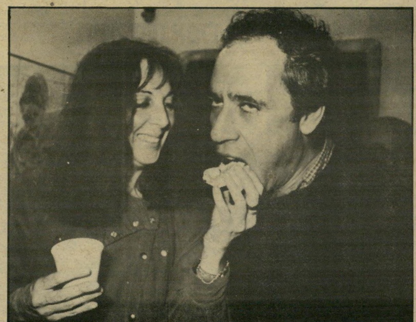
שימירתי מאכילה את בעלה

אויקי. תקראו את הקטע הזה שוב. ותבינו איזה דברים איזמים עושה לי חורף של יום אחד. מתי כבר יהיה שוב קיץ, ואני אחזור לעשתונותי? מישהו יכול לעזור לי בבקשה?