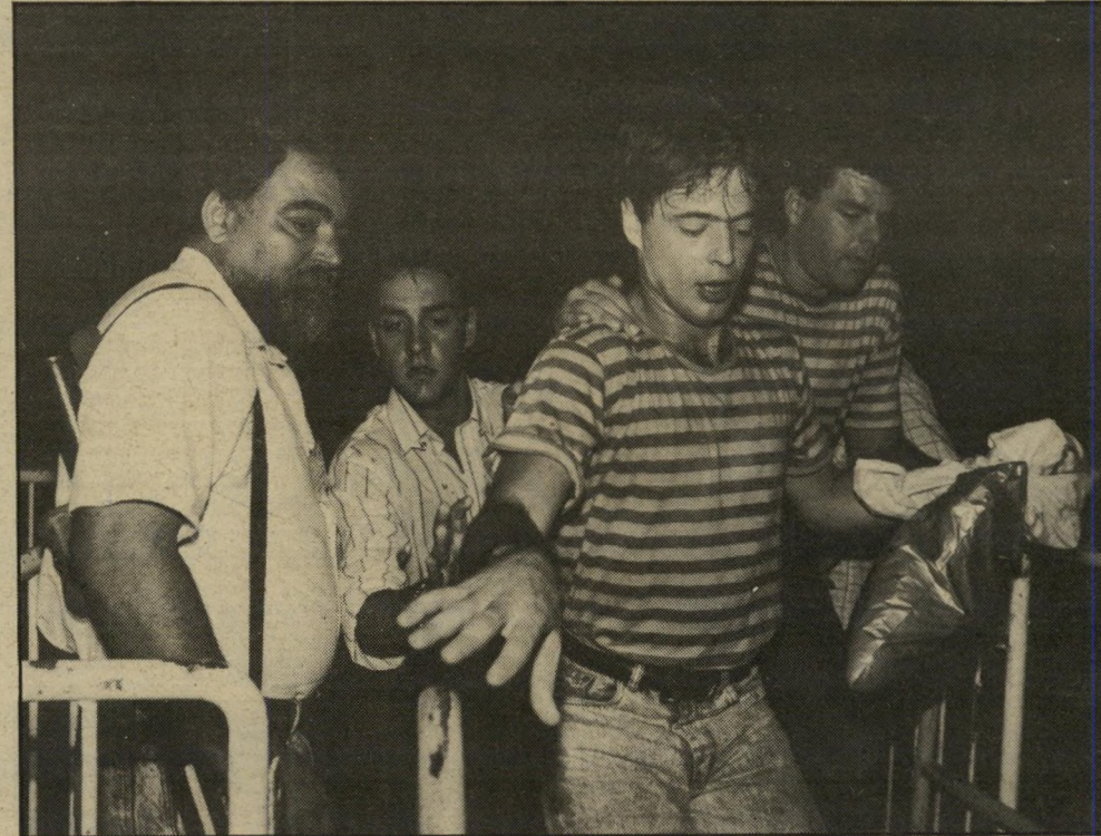
אדם המבוהל מוצא מן המופע מה רוצים ממני, שאעשה צלקת על הפנים?

"כן, זה מחמאי, כל המעריצים, אבל אין לי אגריטרס בגלל זה. זה מחמאי, אבל אני שומר על גבולות. אני טיפוס של ביל יפה, ארבע קירות. "מה יהיה כשכל זה ייגמר? אני אעלה על רכבת אחרת, אני לא רואה את עצמי כך כל החיים". הארבות הגבוהות של רידינג נראות באופן, חורים הביתה, לתל אביב. למרות הפיחוקים והעיניים שלו שכמעט עצמות, הלילה של אדם לא נגמר. יש משיבה שועשה שמרית אור, לפתיחת בית-קפה. אני חייב ללכת. אני אוהב אותה ויודע שגם היא היתה באה בשבילי, אם הייתי עושה מסיבה".