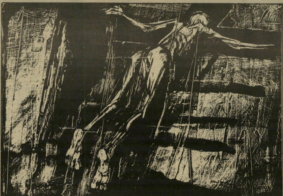
קניספל: ליתוגרפיה ל, בוכביהאפר" של ק. צטניק (1966) ביוס'כיפור, בני אר'אסדי

של גוונים ובניי-גוונים נדירים, הוא מעלה לפרטיי פרטים ובכוח מהפנט ומחשמל אושוויץ אחרת! והרי הטכסט-המנוסקריפט היה בידי מזה חוד"שיים ימים. עברתי עליו שוב ושוב, ולא השכלתי לצלול למצולות תהום המוות והחידלון — היתה כאן, כפי הנראה, הרחקה נואשת של מנגנון-ההישרדות.