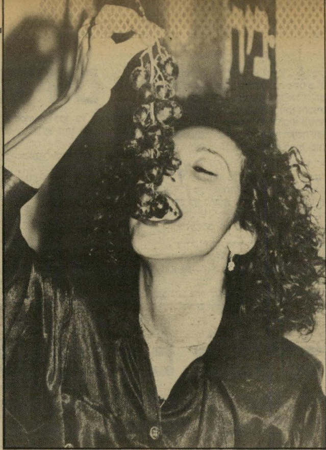
ליכל שדות היחצנית המצלחה, מוכרת גם כבליינית מושגת בעת המכירה את חיי-הלילה של תל-אביב ליל-אורכם ולעומקם. היא הצהירה שהיא חוזרת לתקופת רומי העתיקה.