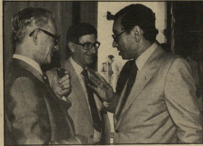
עם קמחי וששון, משלמים לי כרי להיפגש.