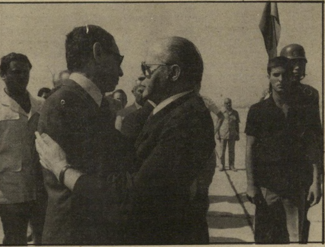
עם בגין, זה היה כדאי, גם לך.

עבורי, אישית. איני מסכים לתיאוריה הגורסת שכל מי שנטל בו חלק — נפגע. זוהי הכללה גסה. צעד כזה הוא חד-פעמי בהיסטוריה. וגם אצלכם — אבר'ה סמיר ואלי-קים רובינשטיין היו שותפים לתהליך השלום ומכהנים כיום בעמדות בכירות בישראל. האם מעמרי נפגע? אני מאחר לפגיי שה הכאה.