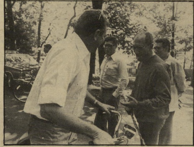
עם סאדאת ועזר וייצמן בקמפדייוויד, פיתחתי ידידות עם אריק שרון.